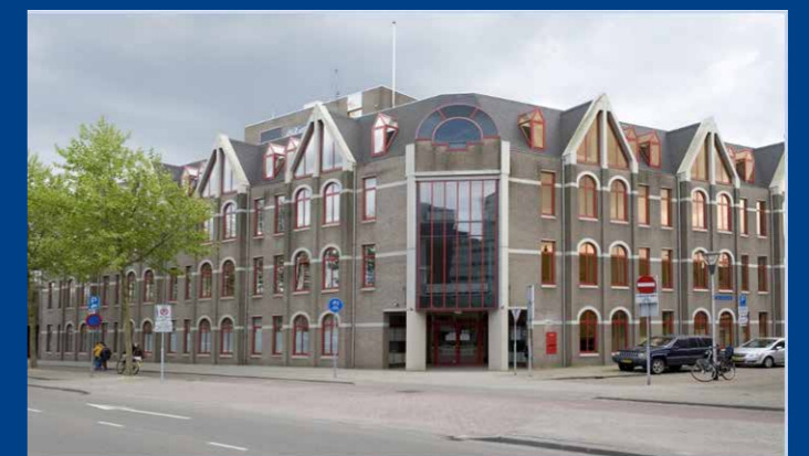
HET ZORG- EN VEILIGHEIDSHUIS MIDDEN-BRABANT, GEVESTIGD AAN SPOORLAAN 448 TE TILBURG.